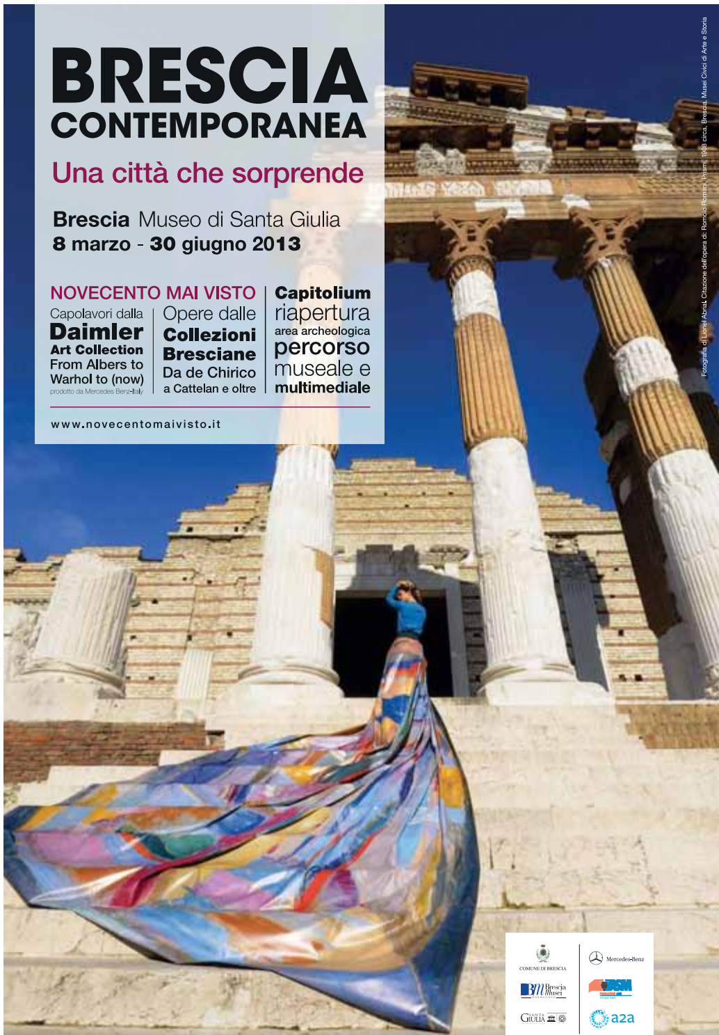
Citazione dall'opera di Romolo Romano, "Brescia", 1988 circa. Brescia, Musei Civici di Arte e Storia